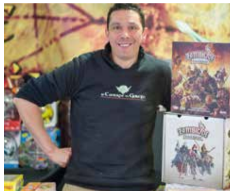
Thibaut, une encyclopédie du jeu de société

Profitez également de cette visite pour repartir avec un des nombreux produits officiels « Festival de Gérardmer ». Mug, clé USB, textiles ou affiches de collection feront le bonheur des aficionados désireux de conserver un souvenir de leur visite en terre gérardoise.