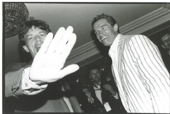
Jean Pigozzi, Mick Jagger et Arnold Schwarzenegger, Hôtel du Cap, Antibes, France, 1990