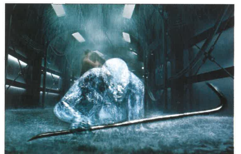
Hollow Man, l'homme sans ombre : une adaptation cinéma de l'Homme invisible, signée Paul Verhoeven. (DR)

Sur le visuel officiel, on le retrouve vêtu d'un complet rouge, la main dans la poche, décontracté. Clin d'œil cinéphile, les bandes de son masque se défont et semblent former une pellicule qui se déroule. Notre vingt-et-unième visuel poursuit la tradition initiée par ses pairs : porter le flambeau du Festival et assurer ses participants d'un registre toujours étonnant !