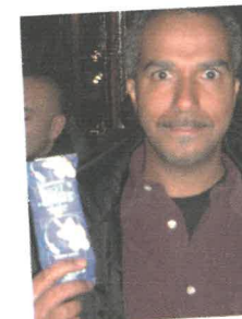
Pascal LEGITIMUS Président du Jury Courts Métrages