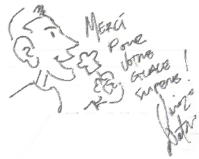
Vincenzo Natali a apprécié les glaces Thiriet

Partenaire officiel de Fantastic'Arts depuis ses débuts, le Conseil Régional s'était engagé à faire de ce dixième anniversaire un vrai succès en organisant des opérations exceptionnelles. Les Soirées rétrospectives, la réalisation d'une bande-annonce du Festival et le parrainage, pour la quatrième année consécutive, du Jury Jeunes ont été une réussite. Au-delà de ces temps forts, l'accueil formidable d'un public toujours plus nombreux et passionné témoigne que nous avons su faire de Fantastic'Arts une grande fête populaire et conviviale. Je tiens à remercier chaleureusement les organisateurs dont l'implication contribue largement au succès de ce rendez-vous incontournable de la Lorraine. Souhaitons que les prochaines éditions nous apportent la même dose de frissons et d'émotions !