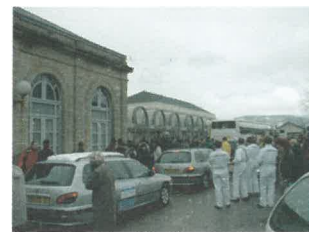
Les navettes du Festival