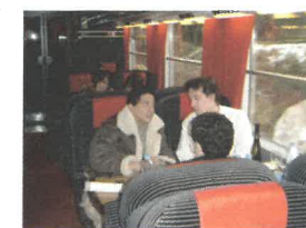
Le train des Stars

du train spécial attendu sur le quai n°4 de la gare de Paris-Est. Et quand le sifflet retentit, notre soulagement de voir tout le monde à bord. Le voyage en lui-même nous apporte beaucoup de joie, côtoyer des stars n'est pas habituel ! Les cuisines dans le train fonctionnent, le service peut commencer, encore un souci de