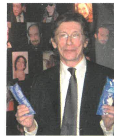
Jean-Pierre DIONNET "Monsieur Fantastique sur Canal +"