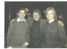
Les lauréats du Concours de bandes-annonces

Le Président du Conseil Régional de Lorraine