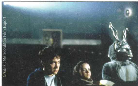
Donnie Darko et le lapin issu de son esprit schizophrène