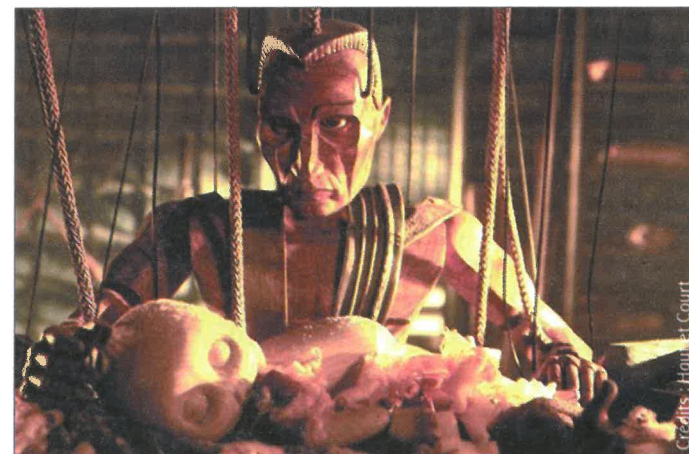
Les marionnettes animées de Strings : le fil de la vie