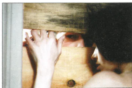
Trouble Every Day, oeuvre sombre teintée de cannibalisme