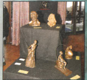
Personnages en argile signés Hervé Thomas (Jeunes Talents 2004)

Préfecture des Vosges ● Sous-Préfecture de Saint-Dié ● Gendarmerie Nationale ● DDE 88 ● A Gérardmer : Police Municipale ● Services Techniques ● Croix Rouge ● Sapeurs Pompiers ● Ecole du Ski Français ● Société des fêtes et cérémonies de la Ville de St Dié