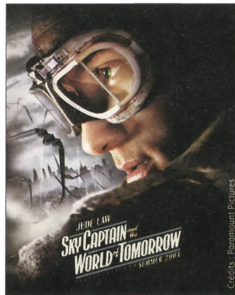
Sky Captain and the World of Tomorrow, un film à l'esthétique remarquable