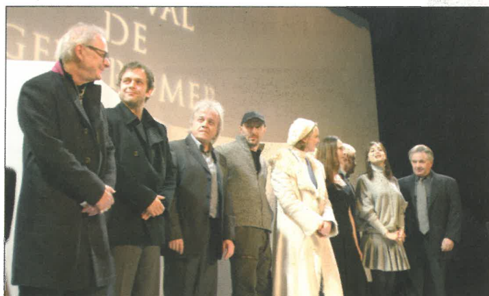
Le jury Longs Métrages lors de la cérémonie d'ouverture

Autour de Barry Levinson, célèbre réalisateur, scénariste, producteur américain et pour l'occasion Président du jury longs métrages, de grands noms du cinéma et de la littérature française composent le jury. On a pu apercevoir hier soir, les charmantes comédiennes Amira Casar, Marina de Van et Agnès Soral. A leurs côtés, représentants