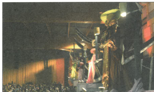
De superbes mannequins décorant la patinoire