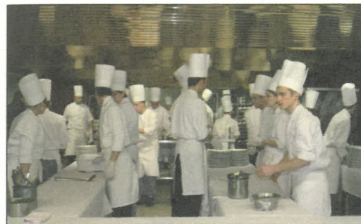
Cuisine en ébullition pour repas de gala