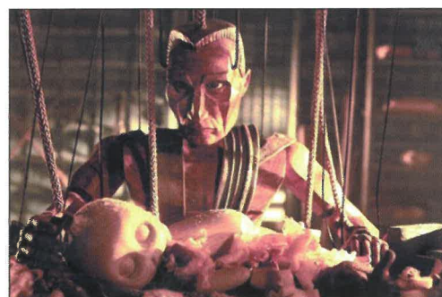
Les marionnettes animées de Strings

L'Espace LAC a été « envahi » hier par les élèves des collèges gérômois qui ont eu l'opportunité d'assister gratuitement à la projection de Strings (le Fil de la Vie). Ils sont venus nombreux (plus de 400) pour découvrir le troisième long métrage du réalisateur danois Anders Ronnow Klarlund. Dans ce film de marionnettes où s'opposent deux peuples, les Zérith et les Hébalien, les spectateurs suivent le périple d'un héros nommé Hal Tara, fils de l'empereur d'Hébalon. Celui-ci, parti sur les traces de l'assassin de son père, tombe amoureux du chef de la tribu ennemie qui n'est autre qu'une charmante jeune femme cachant son visage derrière un masque. C'est en s'éprenant de son ennemie jurée que notre héros parvient à faire régner la paix dans ce monde. Moralisatrice mais néanmoins attirante, cette belle histoire est mise en scène d'une manière très originale. L'idée de filmer des marionnettes en bois reliées à leurs fils est en effet un procédé d'animation tout à fait surprenant. Un film qui a ravi petits et grands.