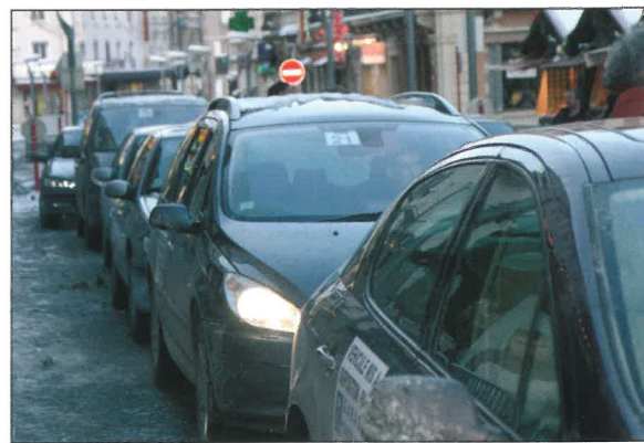
Les taxis devant le Grand Hôtel

Ils connaissent les rues de Gérardmer sur le bout des doigts, ils sont toujours là quand on a besoin d'eux... les conducteurs de navettes qui sillonnent la ville rendent la vie des festivaliers plus facile. Depuis 12 ans, le PC chauffeurs coordonne tous les trajets officiels de la manifestation. Ce service est proposé par 72 bénévoles et leurs responsables : Pierre Tixier et Sylvie Golly. Toute l'équipe véhicule célébrités et journalistes vers les lieux stratégiques du festival et met également à disposition un service extérieur qui rallie Gérardmer aux différents aéroports ou gares de la région. Il faut préciser que sans la participation de Peugeot France et du garage Thiébaud de Gérardmer, qui fournissent 40 voitures neuves, rien ne serait possible.