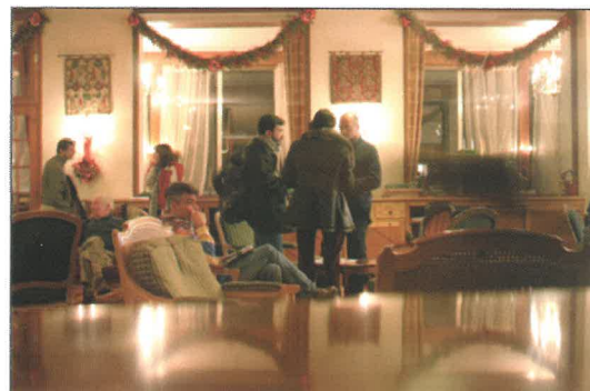
Le salon du Grand Hôtel

Pendant toute la période du festival, l'hôtel est en pleine effervescence. Il s'y passe toujours quelque chose d'intéressant, de drôle, d'inédit... le tout étant de se trouver au bon endroit au bon moment ! Ainsi, on a pu voir il y a quelques années Johnny Hallyday allant se servir directement en cuisine comme bon lui semble pour préparer avec amour une raclette qu'il a ensuite apportée à des fans attablés à l'Assiette du Coq à l'Âne.