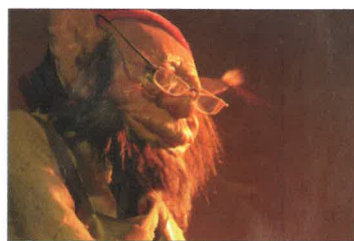
Un drôle de Troll animé