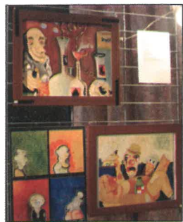
Un aperçu de l'exposition

Après le vernissage de l'expo Arts Plastiques qui s'est déroulé jeudi, les jeunes talents ont à leur tour investi la villa Monplaisir de l'Espace LAC. Ils ont dévoilé leurs œuvres dans le cadre d'une mise en espace réservée aux créateurs débutants. Cette exposition très riche en couleurs et en diversité artistique offre un panel d'artistes des plus intéressants. Leur inspiration tourne principalement autour des états d'âmes : thématique choisie pour l'ensemble du festival 2005. La peinture est la discipline la plus représentée avec des tableaux aux techniques de réalisation variées et originales : aquarelle, peinture à l'œuf, peinture à l'huile... Ces œuvres picturales sont signées Emmanuelle Potier, Pierrick Lourme, Sébastien Grenier, Laurence Paino, Sébastien Schmitt et Remy Kenan. A leurs côtés, les sculpteurs Denis Cunin, Pierre Vexlard et Patrick Masson ont exprimé leur habileté artistique aux moyens de l'argile, la pâte fimo, l'acier et la pierre. L'unique dessinateur, Jean Marie Back, a réalisé ses tableaux au fusain. Cette exposition tout à fait originale a été réalisée par Marie-France Castet et Evelyne Viry. Toutes nos félicitations !