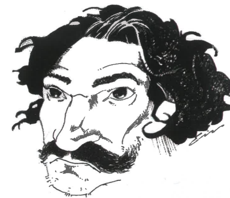
Vincent Cassel dans Sheitan

sont à déposer dans une urne que des bénévoles se chargent de récupérer à l'issue de la séance. Ce prix sera remis lors de la cérémonie de clôture. N'hésitez pas à voter !! C'est une bonne occasion pour donner votre avis sur les films en compétition.