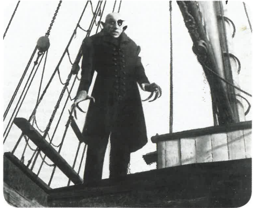
Max Schreck incarne Nosferatu dans un film tourné en 1922

Toute l'organisation du festival vous souhaite un très joyeux Noël et une excellente année 2009 !