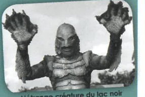
L'étrange créature du lac noir