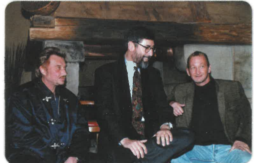
Festival 1999, John Landis (au centre) en compagnie de Johnny Hallyday et Robert Englund

En 2009, la cinémathèque française et le Festival de Gérardmer s'associent pour rendre hommage à John Landis avec une soirée organisée en l'honneur du cinéaste le vendredi 30 janvier à Gérardmer.