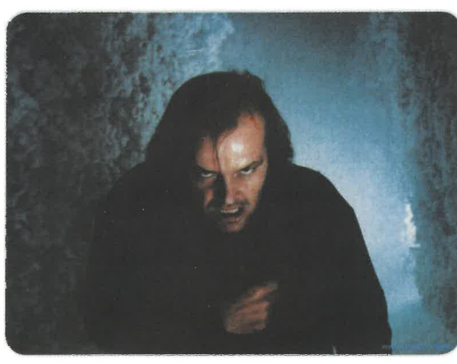
Les teintes glacées de Shining

Jeux de Miroirs, Superstition, États d'Ame ou plus récemment Métamorphoses de la Réalité : Gérardmer se décline autour de thèmes qui ont fait l'histoire du cinéma de l'étrange. Il accorde cette année une attention toute particulière aux Couleurs du Fantastique, l'axe directeur choisi comme leitmotiv permettant à la manifestation de se démultiplier au fil des animations, décorations, concours et bien entendu d'une rétrospective sur grand écran.