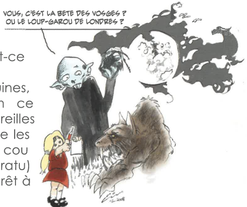
VOUS, C'EST LA BÊTE DES VOSGES ? OU LE LOUP-GAROU DE LONDRES ?

A qui appartient l'inquiétante silhouette représentée sur la nouvelle affiche ? C'est à ses ongles crochus et son crâne lisse qu'on reconnaît, sans même voir son visage et ses yeux charbonneux, Nosferatu, personnage emblématique des années 1930. En 1922, Friedrich W. Murnau ne le sait pas encore, mais son Nosferatu va bâtir le mythe du vampire : un être blafard, difforme, hideux et qui craint la lumière. Le réalisateur a pourtant adapté à sa guise le roman de Bram Stoker, Dracula , où le personnage est élégant, séduisant, et apte à se promener en plein jour dans les rues de Londres. Mais si Murnau a pris quelques libertés, il n'en a pas moins réalisé un film culte, qui a durablement terrorisé des générations de spectateurs : personnage maléfique, décors hostiles, effets spéciaux amplifiant le sentiment de malaise et de surnaturel. Inévitable, donc, de lui rendre hommage, ici à Gérardmer. D'autant que le vampire reste l'une des créatures les plus appréciées des réalisateurs actuels.