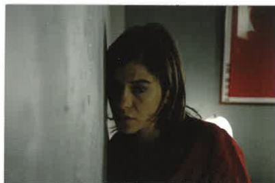
Echo