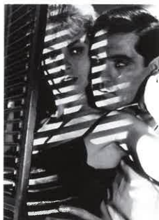
Psychose - Janet Leigh & John Gavin

En point d'orgue de cette thématique, un colloque organisé dans le cadre des Rencontres du Fantastique, se déroulera le samedi 29 janvier. Il réunira psychologues, psychanalystes, professionnels du cinéma et journalistes.