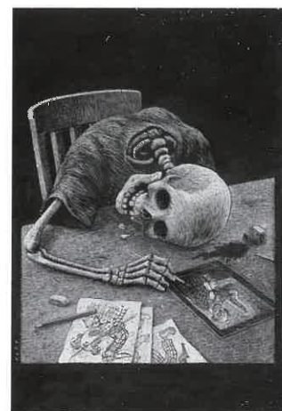
"TOTT's Last Cartoon" de Thomas Ott

Maître dans l'art des illustrations grinçantes et des atmosphères oppressantes, le zurichois Thomas Ott nous fait l'honneur d'exposer ses planches originales à la villa Monplaisir durant le festival 2011. Sa technique de prédilection est la carte à gratter, un procédé consistant à travailler la lumière en grattant la surface de cartons recouverts d'une fine couche uniforme de noir pour faire apparaître le blanc. Ce procédé renforce l'ambiance sombre des dessins. Les bandes dessinées de l'artiste sont essentiellement muettes. T.O.T.T, comme on le surnomme parfois (jeu de mots avec la mort, « Tod » en allemand) économise les mots pour laisser la part belle au dessin. Ses thèmes favoris : l'âme humaine, ses vices et ses angoisses. Son dernier album, R.I.P., regroupe les meilleures planches de ses premières publications. L'artiste dépeint des histoires d'une noirceur insondable mais non dénuées d'une pointe d'humour et même d'espoir, telle une bougie vacillante dans les ténèbres.