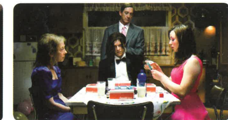
The loved ones