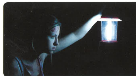
The silent house