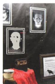
La vitrine gagnante

Pour mémoire, cette « compétition » propose aux commerçants gérardois, et aux particuliers intéressés, de composer autour du thème du festival une vitrine ou un balcon aux décors fantastiques.