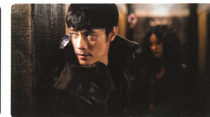
J'ai rencontré le diable