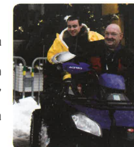
Balade en quad pour les VIP

Aucune performance de vitesse n'est au programme, le maître mot reste avant tout le plaisir, dans le respect de la nature. Départ dans la cour intérieure du Grand Hotel & Spa, à heures régulières.