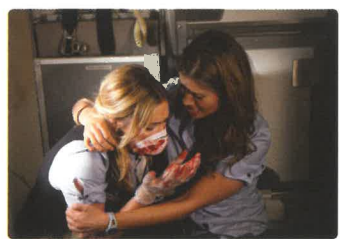
En quarantaine 2