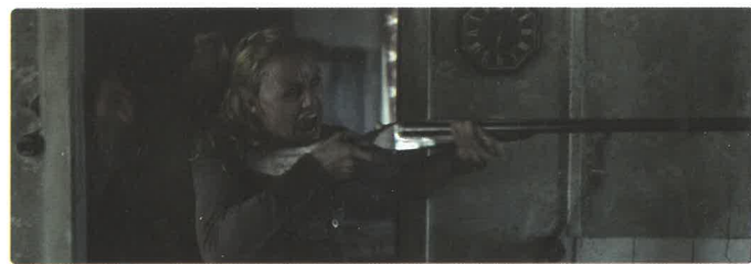
Cold prey 3