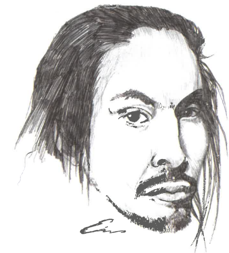
KIM CHAPIRON = DE KOURTRAJME AU JURY COURTS MÉTRAGES, TOUT RENTRE DANS L'ORDRE