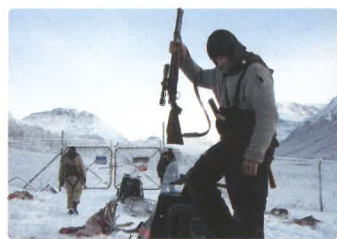
Rare exports : un conte de noel