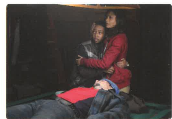
L'empire des ombres