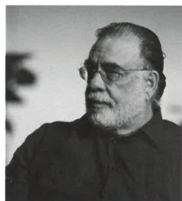
Francis Ford Coppola

Peggy Sue s'est mariée ou Jack, mais aussi Dracula. Dans ce dernier, il innove encore en exploitant une nouvelle facette du personnage de Bram Stoker, jusque là traité comme un monstre assoiffé de sang, pour souligner un côté vampire dandy-romantique, capable d'aimer.