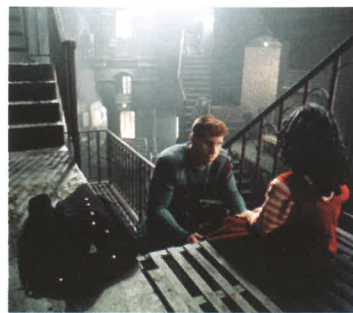
Ron Perlman dans La Cité des Enfants Perdus

Découvert par le grand public en 1981 dans