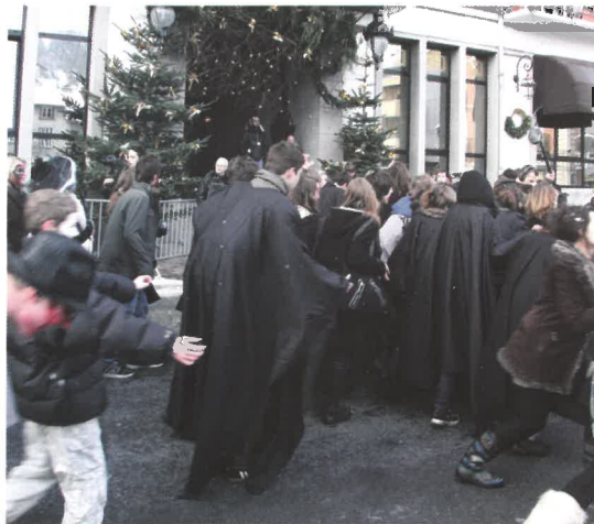
La Zombie Walk 2011