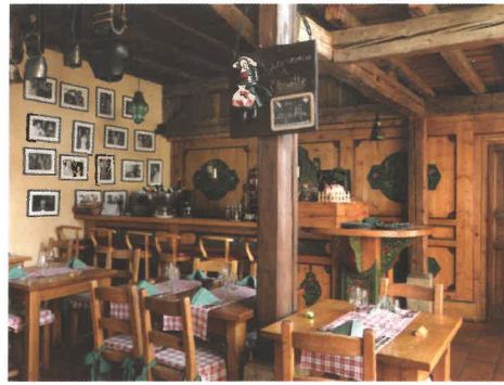
L'Assiette du Coq à l'Âne © Thierry Samuel ▲