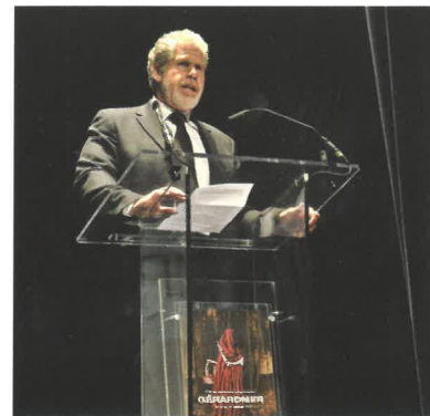
Ron Perlman reçoit un hommage pour l'ensemble de sa carrière

Il ne pratique pas non plus la langue de bois et défie la censure lorsqu'il s'agit d'aborder les productions américaines actuelles. Il les juge creuses, pauvres d'un point de vue scénaristique au profit de films plus commerciaux et grand public. Toutefois, il s'ouvrira l'occasion d'y remédier : à la question « Comptez-vous réaliser un film ? » Perlman répond « oui ». Réjouissons nous !