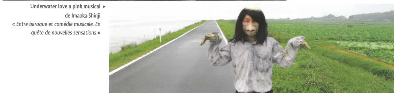
◀ Underwater love a pink musical de Imaoka Shinji « Entre baroque et comédie musicale. En quête de nouvelles sensations »