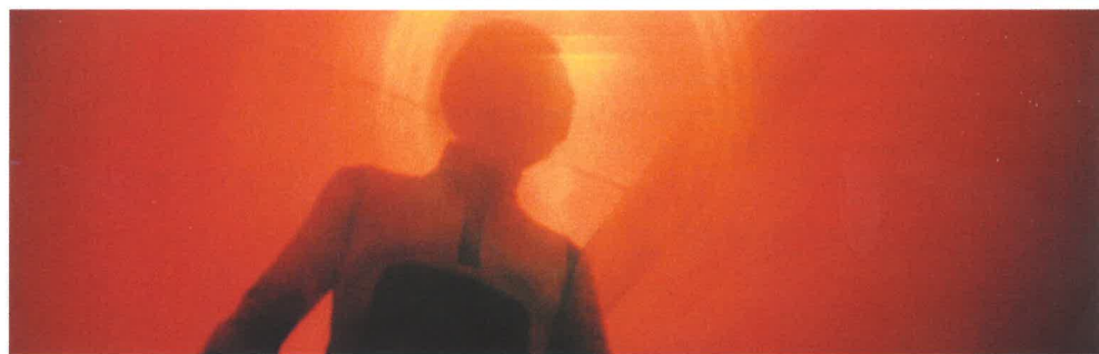
◀ Beyond the black rainbow Pano Cosmatos « Un travail énorme sur les textures »