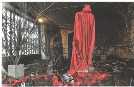
Le vainqueur du prix de la vitrine fantastique ▲

S'étant constituée jury pour l'occasion, la commission décoration du festival a sélectionné, en coup de coeur, le SKÉ BAR pour sa fresque à l'entrée du bar. Ainsi, les membres de l'association géromoise 2B Prod ont inscrit à la bombe leur attachement au Festival de Gérardmer.