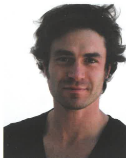
Yves Renier ▲ Comédien