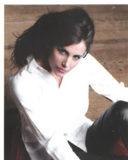
Louise Monot ▲ Comédienne