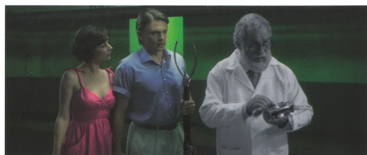
L'attaque du monstre géant suceur de cerveaux de l'espace de Guillaume Rieu ▲ Un monstre attaque une petite ville en transformant les habitants en zombies !