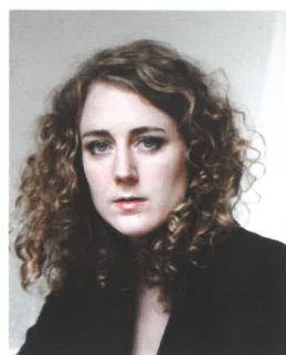
Joséphine de Meaux ▲ Comédienne