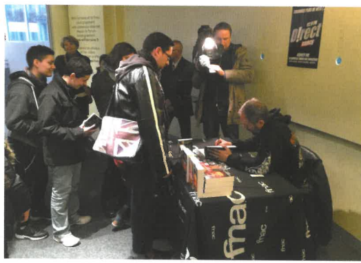
L'auteur Henri Loevenbruck en 2015 au forum Fnac de Nancy

En amont du Festival, durant le mois de janvier, la Fnac organise depuis plusieurs années des rencontres conviant des artistes emblématiques du genre fantastique à parler de leur carrière et de leur travail, lors de forums ayant lieu dans le magasin nancéien de l'enseigne. Préambule aux Rencontres du Fantastique qui se déroulent durant la manifestation, ces temps forts, ouverts à toutes les disciplines artistiques et en entrée libre, prendront cette année la forme d'un show case autour de la musique de film (le 22 janvier 2016 à 17h) organisé en partenariat avec MAI Nancy ( www.maifrance.com ), et d'une ou plusieurs rencontres avec des auteurs de romans ou de BD dont les dates restent à fixer.