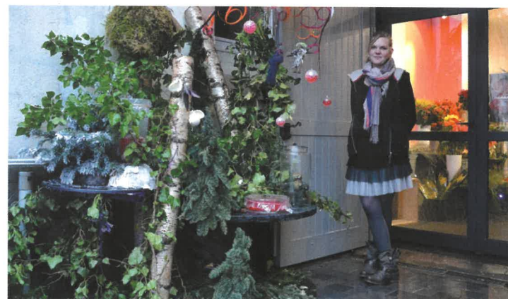
Concept Fleur : lauréat de l'édition 2015 du concours de vitrines

C'est une tradition. Chaque année depuis la première édition, les commerçants de Gérardmer (ainsi que quelques particuliers) participent au concours de vitrines et balcons organisé par le festival, en collaboration avec Gérardmer Animation. Tous sont invités à revisiter un thème proposé - cette année Labyrinthe de L'Ame, en lien avec le visuel de l'affiche - et à laisser libre cours à la créativité. Pour les départager, un jury composé de représentants de la commission Décoration du festival, de l'association des commerçants et du partenaire du concours, la maison de champagne Cristian Senez*, qui offre les dotations : un Mathusalem (6 litres) pour le 1 er prix et un Jéroboam (3 litres) pour les trois suivants. Une visite du domaine Senez (situé à Fontette dans l'Aube) est également mise en jeu lors d'un tirage au sort. Elle invite le gagnant à découvrir la propriété viticole : balade dans les vignes, dégustation en cave et casse-croûte. La remise des prix du concours se déroulera le vendredi 29 janvier à l'Espace Tilleul (horaire à préciser). Inscriptions auprès du festival.