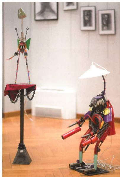
Les sculptures robotiques de Gilles Bellagamba

En complément de ces artistes, le Centre d'Enseignement de la Maison d'Arrêt d'Epinal a eu le privilège d'exposer trois de ses travaux, sur invitation du Festival, au côté de la quarantaine d'oeuvres présentes sur place.