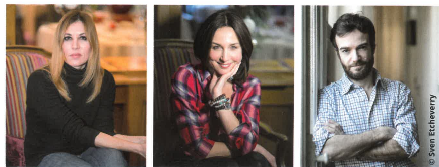
Mathilde Seigner, Elsa Zylberstein et Jonathan Lambert interviewés pour le Petit Fantastic

Retrouvez les interviews complètes sur www.festival-gerardmer.fr