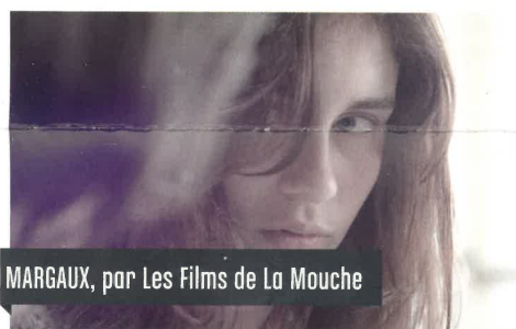
MARGAUX, par Les Films de La Mouche

Dans ce court-métrage presque muet, Adrien Jeannot évoque la paranoïa ambiante sur les questions d'immigration et la gestion de l'emploi en France à travers un univers à l'humour noir et décalé.