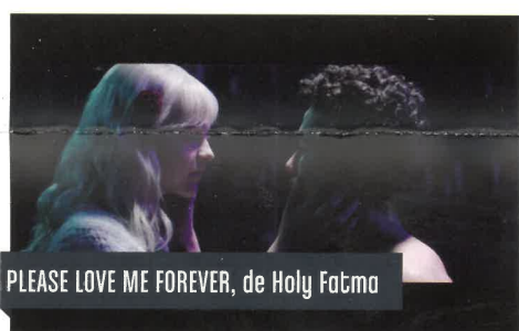
PLEASE LOVE ME FOREVER, de Holy Fatma

Les Films de la Mouche est composé de 3 jeunes réalisateurs spécialisés dans le cinéma de genre. À travers leurs courts-métrages, ils cherchent à trouver l'équilibre entre poésie et frontalité. Avec Margaux , ils poursuivent leur travail en se plongeant dans l'univers de la science-fiction.