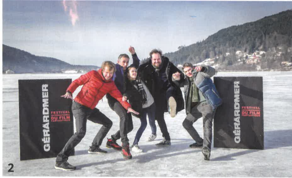
1/ Le Jury Longs Métrages - 2/ Le Jury Courts Métrages - 3/ Kiyoshi Kurosawa