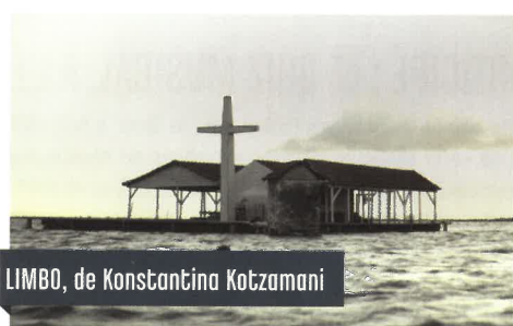
LIMBO, de Konstantina Kotzamani

Pierre Teulière promène son regard sur le monde qui l'entoure. Du paysage des grandes métropoles aux contrées lointaines, entre culture urbaine et cultures d'ailleurs, il capture les instants, fabrique des histoires et met son monde en images.