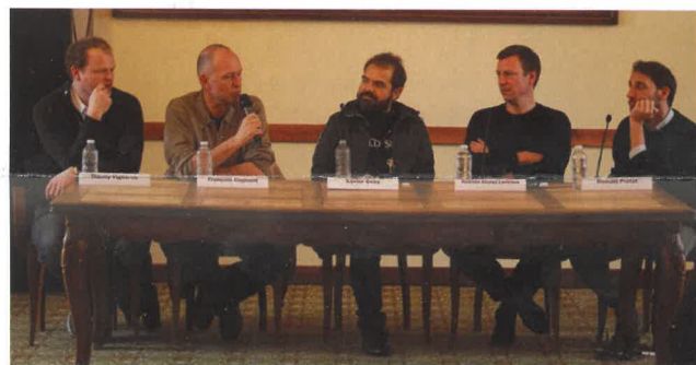
Retrouvez l'intégralité de la rencontre sur le site du festival : www.festival-gerardmer.com

dans la rénovation des cinémas indépendants. Ensuite, la Région Grand Est accueille un grand nombre de festivals. Gérardmer bien sûr mais aussi le Festival transfrontalier franco-allemand ou encore le Festival international de cinéma War on Screen... Et si l'aide aux tournages est la partie la plus visible de notre soutien, elle vient finalement concrétiser un projet né bien avant. Un avant pendant lequel nous tenons à être présents. Aujourd'hui la politique d'accueil des tournages est très structurée. Notre fonds de soutien atteint près de cinq millions d'euros. Nous avons fait plus de 400 jours de tournages l'année dernière. Et nous avons trois films engagés aux César 2018.