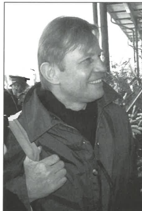
Michael York en gare de Remiremont

La neige aura eu raison de la volonté des organisateurs : William Friedkin ne pourra remplir son rôle de président du Jury Longs-Métrages, coincé sous une tempête de neige new-yorkaise. Pour le remplacer au pied levé, le plus élégant des acteurs anglais, Michael York.