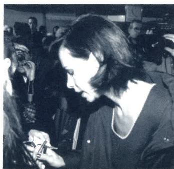
Mathilda MAY en pleine séance d'autographes

La compétition est ouverte : deux films, "Seven days to live" et "Chasing sleep", ont été présentés hier à l'Espace Lac. Le Festival est entré définitivement dans le vif du sujet. Aujourd'hui, le Jury sera au grand complet avec l'arrivée très attendue de Roland Joffé.