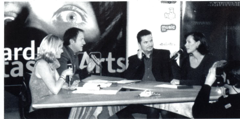
Mathilda MAY sur le plateau de RTL9

Avec le soleil, ça n'est pas plus mal. Hier matin, à l'unanimité, les festivaliers ont certainement apprécié. Dans ces conditions, rien de tel qu'un léger footing le long du lac pour effacer les dernières effluves d'une soirée de gala désormais réglée comme du papier à musique. En aucun cas cette soirée ne pouvait prêter le flanc à la critique, en vertu des efforts successifs et conjugués, produits jusqu'ici par les commissions de la logistique, de la décoration, du protocole, des hôtes, des chauffeurs, de la sécurité, sans oublier ce travail titanesque accompli par les professeurs et élèves du lycée hôtelier.