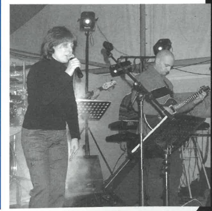
Le "Jiminy Cricket Band"

Le "Jiminy Cricket Band" de Metz a inauguré hier soir la série de concerts offerts sous le chapiteau, place du Tilleul. Aujourd'hui, l'espace réservé à cet effet sera investi par "Rockin'Jack", un groupe de rock gérois. Début du concert à 18 h 30.