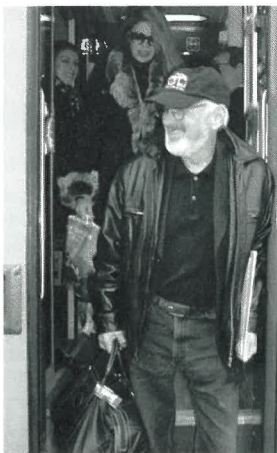
Norman Jewison descendant du train des festivaliers

peu de repos autour d'un verre avant de passer sous les feux de la rampe lors de la proche cérémonie d'ouverture. Patrick Braoudé s'entretient avec les organisateurs du Public Système Cinéma, Georges Wolinski revient d'une ballade dans les rues de la ville et Thomas Dutronc téléphone accoudé au bar de l'accueil. Ambiance, ambiance... le Festival reprend tout doucement le rythme des années précédentes. Les acteurs changent, le scénario s'invente au jour le jour mais, vu de l'intérieur, il possède toujours cet aspect convivial, cette pointe d'intimité qui nous rappelle la chance que nous avons d'accueillir chaque année un événement de cette envergure.