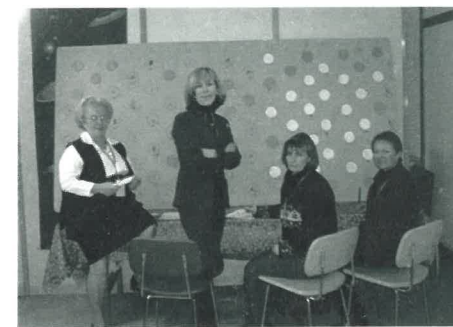
L'exercice complexe du placement des invités