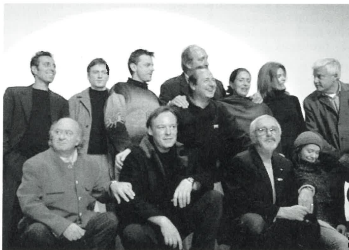
Un magnifique Grand Jury 2002

"Je déclare ouverte la 9 ème édition du Festival du Film Fantastique de Gérardmer !". C'est avec un accent venu d'outre atlantique, quelques hésitations dans les mots, une casquette vissée sur la tête et un charisme formidable que Norman Jewison, Président du Grand Jury, a prononcé la phrase symbolique lors de la cérémonie d'ouverture hier soir à l'Espace L.A.C. Ce Grand Monsieur du cinéma, réalisateur de renom récompensé par la bagatelle de onze Oscars sur l'ensemble de sa carrière, ne maîtrise certes pas encore parfaitement notre langue mais manie la caméra de main de maître. Avec des films comme "Le kid de Cincinnati", "Dans la chaleur de la nuit", "L'affaire Thomas Crown", "Un violon sur le toit", "Rollerball", "Eclair de lune" ou "Hurricane Carter", Norman Jewison apporte à Fantastic'arts une dimension internationale et l'expérience nécessaire au bon déroulement des délibérations du Jury Longs Métrages. Chaudement applaudi lorsque le présentateur de la soirée l'a convié sur la scène, il suffisait de regarder les airs, tour à tour émerveillés, respectueux ou fascinés des autres personnalités présentes ce soir là pour s'en assurer. Même Bernard Farcy qui, quelques minutes auparavant, amusait l'assemblée en prenant lui-même des photos des journalistes, est rentré dans le rang à la venue du réalisateur canadien.