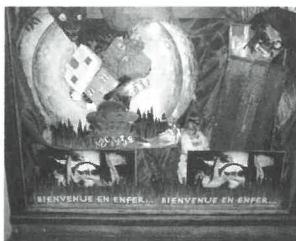
Une des soixante vitrines participant au concours Canal Plus

A l'occasion du 9ème Festival de Gérardmer, Canal Plus et Racer organisent un grand jeu concours portant sur les vitrines de la ville. Celui-ci comporte deux compétitions bien distinctes.