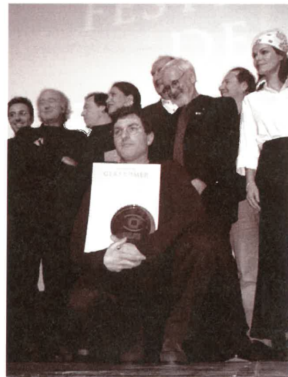
La remise du Prix décerné par le Grand Jury