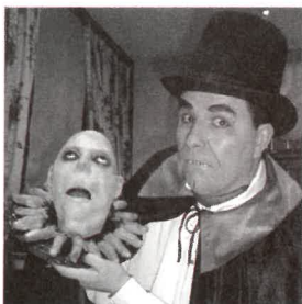
Charlie Panto et Oncle Fétide