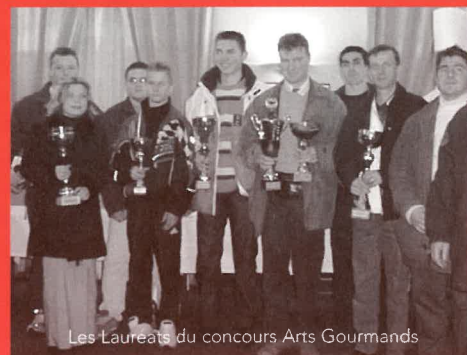
Les Laureats du concours Arts Gourmands

Dimanche après-midi, le jury des arts de la table a décerné les prix récompensant les pâtissiers les plus talentueux ayant concouru cette année. Les pièces gagnantes sont les suivantes :