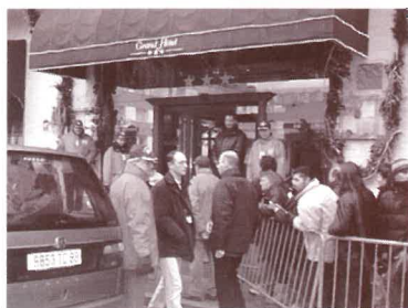
Les agents de sécurité devant le Grand Hôtel

cinq jours de festivités, le renfort des élèves du Lycée Jeanne d'Arc de Bruyères qui, dans le cadre d'une convention signée avec l'Association du Festival et la Région Lorraine, envoie une cinquantaine de stagiaires des classes "Sécurité" en formation sur le terrain.