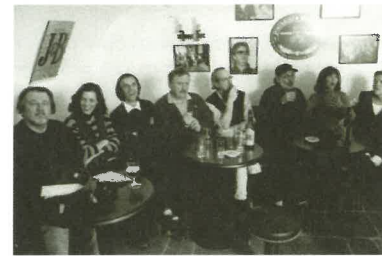
Le 1 er jury longs métrages au Grand Hôtel