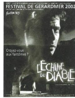
L'affiche de "L'Echine du diable" estampillée "Festival de Gérardmer"

certaines productions étrangères non-conformistes, en vue d'une éventuelle exploitation en France. Jean Pierre Dionnet, spécialiste des films de genre et grand amateur de cinéma asiatique, nous avait ainsi proposé l'année dernière quelques-unes de ses découvertes et notamment le très mystérieux "Uzumaki". Or, à force de présentation dans des festivals, certaines productions se taillent de solides réputations auprès des fans, voire de la presse. Le film "Jeepers Creepers" sorti le 03 juillet dernier constitue un bon exemple de ce phénomène car son arrivée à Gérardmer était précédée de critiques très élogieuses dans les pages des magazines spécialisés. Pour donner encore plus de poids à l'acte promotionnel que constitue la participation à un événement comme Fantastic'arts, certains réalisateurs et acteurs acceptent de se déplacer en personne. Ce fut notamment le cas pour Bill Paxton venu à Gérardmer en 2002 pour parler de son film "Frailty" sorti le 15 mai dernier. Toutefois, malgré leur passage dans un festival, certains films au caractère très élitiste (ou très violent), éprouvent beaucoup de difficultés à se faire une place dans la multitude de longs métrages frappant à la porte des circuits de distribution. Certaines productions tentent quand même leur chance en salles comme "Cubbyhouse" sorti le 14 août 2002. Mais le résultat est souvent décevant car le film ne sort que dans un nombre très restreint