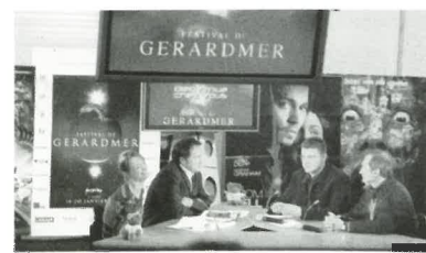
Plateau RTL9, un rendez-vous quotidien en direct du Festival

(6 mn). Concernant le site Internet réalisé par 2ST ( www.gerardmer-fantasticart.com ), les taux de fréquentation de février 2001 à janvier 2002 sont les suivants : nombre de connexions sur la page d'accueil : 2020877, nombre de fichiers chargés à l'écran : 1451549, nombre de pages visitées : 421282 et nombre de visites prolongées : 56440. Merci donc à tous les journalistes et professionnels de l'audiovisuel contribuant à donner au Festival une envergure sans cesse croissante.