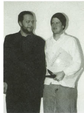
Richard Kelly (à droite) recevant le "Prix Première du public" pour Donnie Darko

Le Festival de Gérardmer apporte donc beaucoup aux films qu'il prend sous sa coupe chaque année. Lieu d'échange et de transmission des créations artistiques, le rôle important qu'il joue au sein des milieux cinématographiques pour la promotion des oeuvres ne reste pas sans retour. En effet, c'est à travers la qualité des films primés que s'affiche celle d'une manifestation. "Donnie Darko", "L'Echine du Diable" et "Fausto 5.0" sont de bons films et leur sortie estampillée "Fantastic'arts" a permis de renforcer l'image positive que le public se fait du Festival. Gérardmer référence en matière de cinéma fantastique... une tendance qui se confirme désormais fortement!