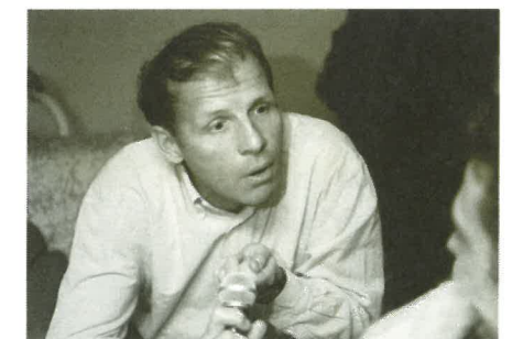
P.P.D.A. : journaliste et cinéphile

Palmarès pur cinéma et stars hollywoodiennes dans les rues de Gérardmer, le 6 février 1994 la première édition de Fantastica s'achève sur une mélodieuse note d'optimisme. La ville fut pendant une semaine le théâtre d'une fantastique histoire, une mise en abyme d'une ville avec son festival, tous deux se déclinant sur un thème commun et laissant présager d'un avenir radieux. (à suivre...)