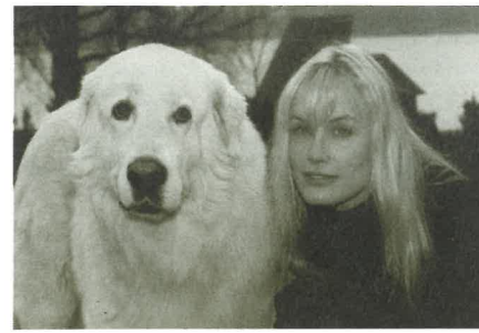
Daryl Hannah, une des premières étoiles du Festival