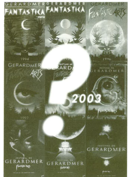
Un 10 ème anniversaire plein de surprises

Il faut donc faire preuve de patience car, peu à peu, le Petit Fantastic révélera les réjouissances annoncées. Il n'est pourtant pas interdit de laisser son imagination travailler... il se peut alors que certains rêves deviennent réalité !