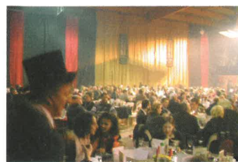
800 convives à la patinoire

Malgré la neige présente tout au long de cette première journée, 800 personnes (festivaliers, partenaires et bénévoles) ont répondu présent à l'invitation pour la soirée de gala d'ouverture célébrant le 10 ème anniversaire du Festival de Gérardmer. En une heure, pratiquement toutes les tables de la patinoire sont comblées. L'ambiance est à son paroxysme, les discussions préalables portent sur la projection du film d'ouverture "Darkness" et les premières impressions sur l'arrivée à Gérardmer.