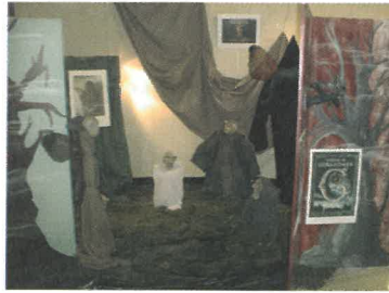
L'espace Fantastic'arts à la Maison de la Lorraine

Chaque année en janvier, un espace réservé à Fantastic'arts est mis à disposition par Madame