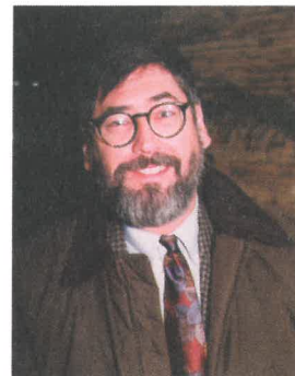
John Landis : Président du Jury 1999

1999 qui leur est en grande partie consacré. "Psycho" le film d'ouverture (remake d'un film d'Hitchcock), la rétrospective sur les tueurs psychopathes et le colloque réunissant des spécialistes en criminologie s'inscrivent dans cette logique. Malgré le risque de tomber sous les coups d'un Freddy Kruger (alias Robert Englund) venu passer quelques jours à Gérardmer, la qualité des invités présents entre le 27 et le 31 janvier 1999 est extraordinaire. Aux côtés de John Landis (réalisateur du mythique "Loup garou de Londres" et Président du Jury), le public découvre Asia Argento, Romane Bohringer, Alexandra Vandernoot, Laurent Gerra, Jean-Pierre Jeunet,