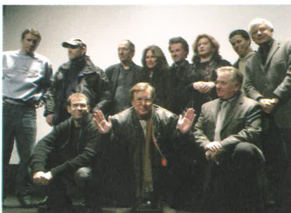
Grand Jury 2003

Cette année 2003 marque le 10 ème anniversaire de Fantastic'arts, et c'est sous de neigeux augures qu'a pu s'illuminer l'Espace L.A.C. pour donner libre cours à la cérémonie d'ouverture. Alors que micros, flashes et objectifs activent leurs mécanismes autour des personnalités, le public prend place sur les strapontins carmins et silencieux de la grande salle de projection. Il faut laisser le temps à l'obscurité d'infuser l'atmosphère,