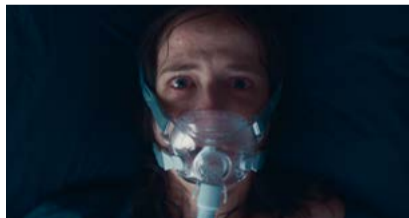
THE NOCEBO EFFECT — LORCAN FINNEGAN

Qui ? Formée aux arts visuels à New York, l'Israélienne Ann Oren œuvre désormais entre Berlin et Tel-Aviv. Après quelques courts métrages, elle signe ici son premier long. Quoi ? Dans la lignée de son court métrage Passage , Oren continue d'explorer l'identification de l'homme à l'animal à travers les errances érotico-sensorielles d'une femme bruiteuse qui voit peu à peu une queue de cheval pousser sur son corps. #métamorphose #obsession #manimal