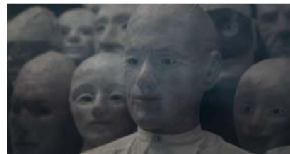
ZERIA — HARRY CLEVEN

Qui ? La réalisatrice américaine Chloe Okuno s'est fait remarquer pour son court métrage horrifique Slut . Watcher est son premier long. Quoi ? Fenêtre sur cour d'Hitchcock n'a qu'à bien se tenir ! Chloe Okuno lui délivre une version au féminin qui flirte dangereusement avec l'horreur, à travers l'histoire d'une comédienne roumaine installée aux États-Unis qui se sent épiée par une étrange silhouette... #jumelles #voyeurisme #fêtedesvoisins