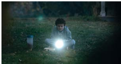
BLOOD — BRAD ANDERSON

Qui ? Après des débuts placés sous le signe de la comédie romantique, Brad Anderson change de registre en passant définitivement du côté obscur de la toile avec l'oppressant Session 9 en 2001. Porté par une aura mystérieuse et la performance saisissante de Christian Bale, The Machinist reste aujourd'hui encore son film le plus personnel. Quoi ? Après son divorce, une mère de famille emménage à la campagne avec ses deux enfants. Un soir, Owen, le cadet, est gravement mordu par un chien qui rôdait autour de la ferme. À l'hôpital, il découvre qu'il a un besoin vital de boire du sang. Aimante, sa mère va maintenant se charger de lui préparer les repas qu'il lui faut... #sang #miammiam