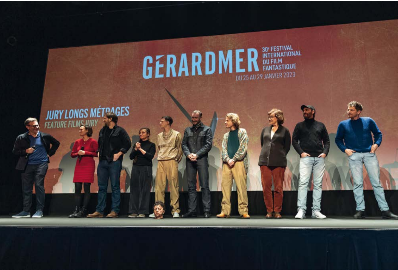
C'est avec beaucoup d'humour que Bérénice Béjo et Michel Hazanavicius ont déclaré ouverte la 30 e édition du festival. Ils étaient hier sur scène aux côtés de Pierre Rochefort, Catherine Ringer, Finnegan Oldfield, Sébastien Marnier, Alex Lutz, Anne Le Ny, Gringe et Pierre Deladonchamps (de gauche à droite).