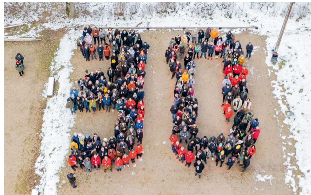
Afin de souhaiter un bon anniversaire au Festival, bénévoles et festivaliers se sont rassemblés pour une photo inédite vue du ciel au bord du lac, avec la complicité de l'Office de tourisme communautaire Gérardmer Hautes Vosges et de sa pilote de drone !