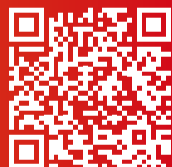
QR code pour voter pour le Prix du public

Durant toute la saison d'hiver, Gérardmer Stations, qui regroupe les domaines de ski alpin et nordique, offre 15 % de réduction sur ses forfaits, sur présentation d'un justificatif d'achat d'un pass cinéma du Festival, quel que soit le type.