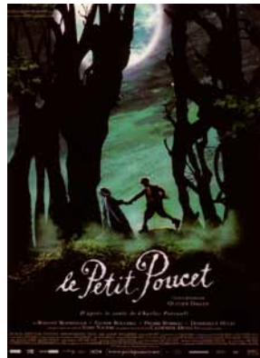
Le Petit Poucet d'Olivier Dahan ▲

Cette demande d'association émane de l'Alliance Française d'Espagne elle-même qui justifie son choix par le fait que « le festival, et la passion qu'il met chaque année à développer afin de mettre en