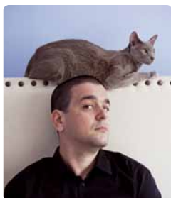
Joann Sfar ▲