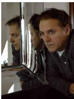
Enki Bilal ▲

Innovation cette année avec, pour la première fois dans l'histoire du festival, un grand nom du 9 ème art comme Président du jury longs métrages. Enki Bilal, artiste emblématique à plusieurs titres est un créateur « polymorphe » avant tout reconnu pour ses dessins ( La Trilogie Nikopol notamment) mais aussi un réalisateur et scénariste. Il a produit une grande quantité de BD et romans, plusieurs films et collaboré à l'écriture d'ouvrages associant fantastique et science-fiction. Au sein du jury, il sera épaulé par sept personnalités représentatives de la diversité et de la qualité artistique française :