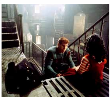
Ron Perlman dans La Cité des Enfants Perdus

Découvert par le grand public en 1981 dans