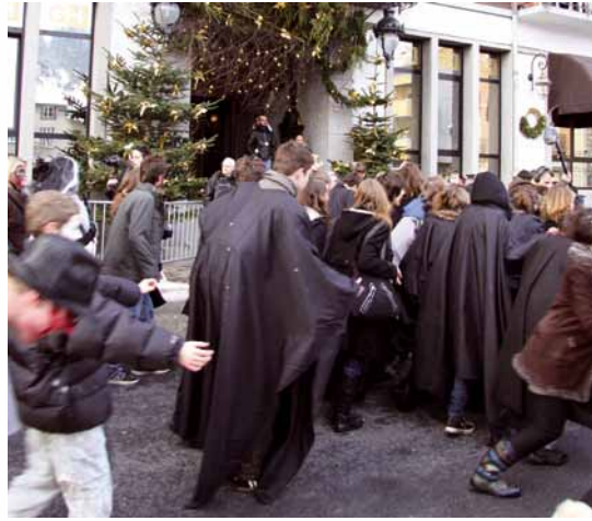
La Zombie Walk 2011 ▲