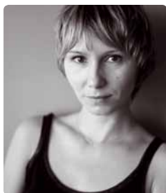
Dinara Drukarova ▲