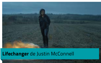
Lifechanger de Justin McConnell

Réalisé et scénarisé par le Canadien Justin McConnell, Lifechanger séduit grâce à un concept scénaristique fort. Un drame fantastique hybride, lorgnant avec la romance. Le destin d'un homme qui pour survivre doit changer d'enveloppe corporelle en tuant son « propriétaire ». Un récit qui saura surprendre par son originalité et sa profondeur thématique