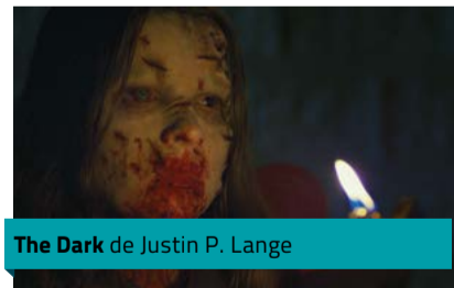
The Dark de Justin P. Lange

Le réalisateur coréen Park Hoon-jung nous plonge dans un univers pesant. Les pouvoirs d'une jeune femme, Ja-yoon, sont terriblement convoités. Alors que cette dernière ignore tout de ses capacités surnaturelles, elle va devoir se battre pour survivre.