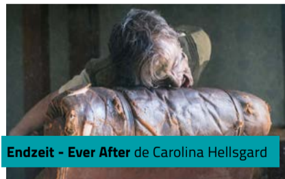
Endzeit - Ever After de Carolina Hellsgard

Un film réalisé à dix mains, ce n'est pas courant... Mais les cinq amis d'enfance du collectif Crazy Pictures ne voulaient rien laisser au hasard. Le résultat, un film à la poésie mystérieuse et angoissante où, dans une Suède plongée en plein chaos, un jeune homme s'efforce de renouer des liens qu'il pensait à jamais brisés.