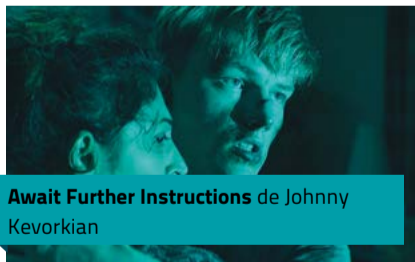
Await Further Instructions de Johnny Kevorkian

Portée par son prix du Meilleur premier film à la Berlinale de 2015, Carolina Hellsgard a décidé, pour son deuxième long, de se frotter au film de genre zombiesque, option « post-apocalyptique ». Un nouveau défi que la réalisatrice suédoise a choisi de relever entourée d'une équipe 100 % féminine. Une première au pays des zombies.