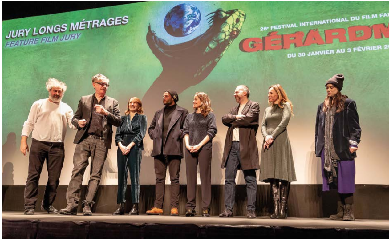
« Nous avons envie d'avoir peur, nous avons peur » a déclaré Benoît Delépine, sur fond de serpent géant dévorant le monde. Flanqué de son compère Gustave Kervern, le coprésident du jury du 26° Festival International du Film Fantastique de Gérardmer a fait rire la salle de l'Espace LAC lors de la cérémonie d'ouverture. La promesse d'une édition détonnante.

26° FESTIVAL INTERNATIONAL DU FILM FANTASTIQUE