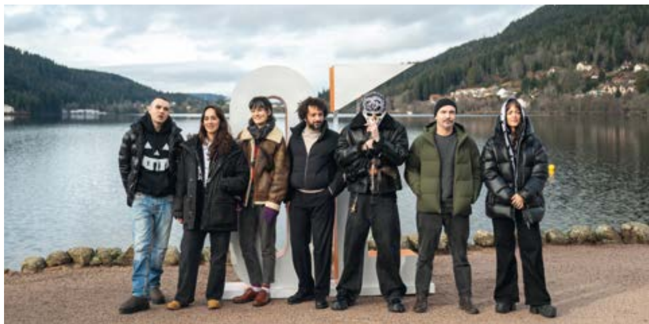
Le Jury longs métrages lors du photocall sur les bords du lac.