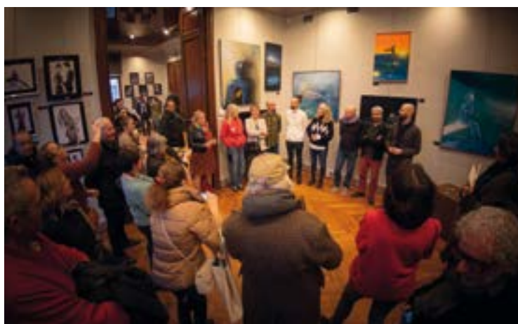
Vernissage de l'exposition « Arts Plastiques » en présence des artistes. Espace LAC, Villa Monplaisir.

Atelier musical : Samedi 1 er février de 14h à 15h, auditorium de la Maison de la Musique (inscription : ecoledemusique@ccghv.fr ).