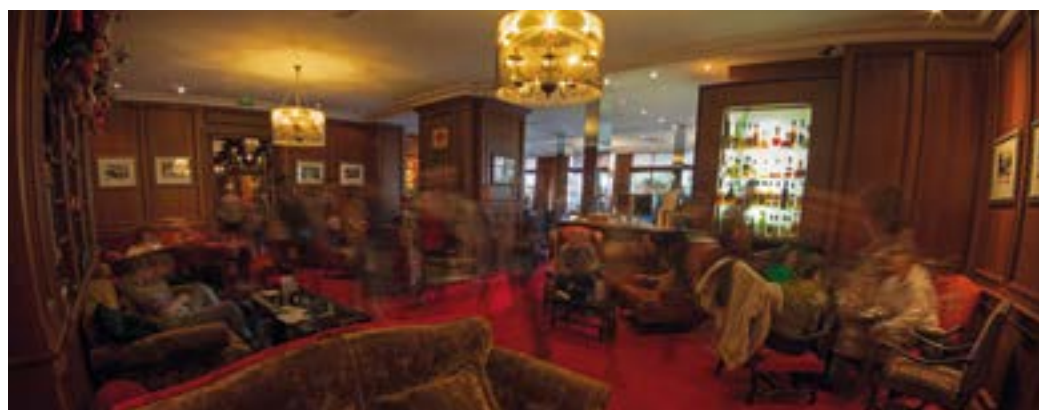
Avec ses trois restaurants ouverts à la clientèle extérieure durant l'événement, le Grand Hôtel & Spa de Gérardmer est un partenaire historique du Festival et s'impose comme un des lieux incontournables de la manifestation !