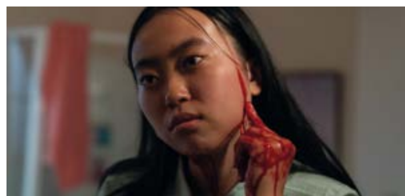
Grafted de la réalisatrice néo-zélandaise Sasha Rainbow